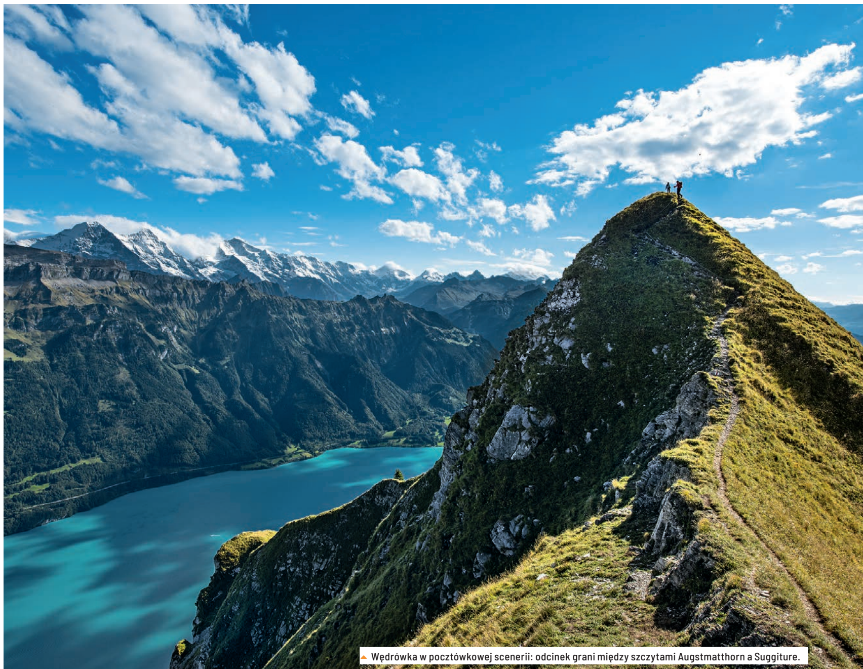
▲ Wędrówka w pocztówkowej scenerii: odcinek grani między szczytami Augstmatthorn a Suggiturne.

Wprawdzie podejście nie jest trudniejsze od tego, co mamy już za sobą i co czujemy w nogach, jednak człowiek chętnie korzysta na krótkim odcinku z zamontowanych stalowych lin. Niewykluczone, że dotarcie na Augstmatthorn 📍, 2136 m, wywoła mieszane uczucia – z jednej strony jest się prawdopodobnie szczęśliwym z faktu pokonania ostatniego podejścia, ze świadomością, że do punktu końcowego pozostała już tylko wędrówka łatwymi szlakami, a z drugiej strony człowiek stwierdza, że w tym miejscu kończy się spokój i samotność, jakie towarzyszyły nam na długiej trasie graniowej. Augstmatthorn jest ze względu na łatwą dostępność i raczej krótką drogę wejściową popularnym i tłumnie odwiedzanym szczytem. I nie ma się co dziwić, jeśli widziało się kiedyś wspaniałą panoramę powyżej jeziora Brienzersee. Trzymając się znakowanego na biało-czerwono-biało szlaku, na dobre opuszczamy chwilę za Augstmatthornem grani i schodzimy do Lombachalp 📍, gdzie w restauracji Jägerstübli Lombachalp chętnie wznosimy toast za, miejmy nadzieję, udaną trasę granią Brienzergrat.