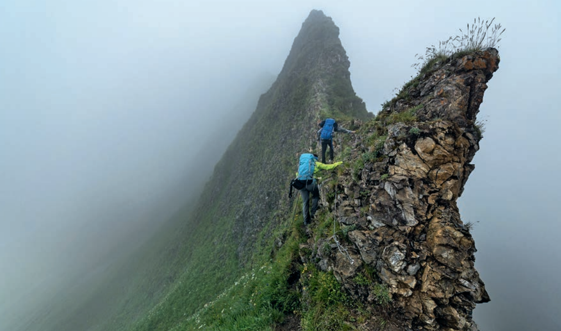
▲ Miejsce kluczowe grani Brienzergat – wejście na Tannhorn.

2207 m. Mając teraz nieustannie w zasięgu wzroku jezioro Eisee, znów ruszamy w dół do skrzyżowania dróg nieopodal przełęczy Eiseesattel, 2025 m. Tu zaczyna się ostatnie podejście dnia – wschodnią flanką raz jeszcze dobre 300 m deniwelacji w górę na najwyższy punkt (2350 m) całej grani Brienzergat, szczyt Brienzer Rothorn ④. Do hotelu Rothorn Kulm ⑤ trzeba ponownie zejść kilka minut. O zachodzie słońca warto raz jeszcze podjąć kilkuminutowy wysiłek i powędrować na wierzchołek Schongütsch (2319 m).