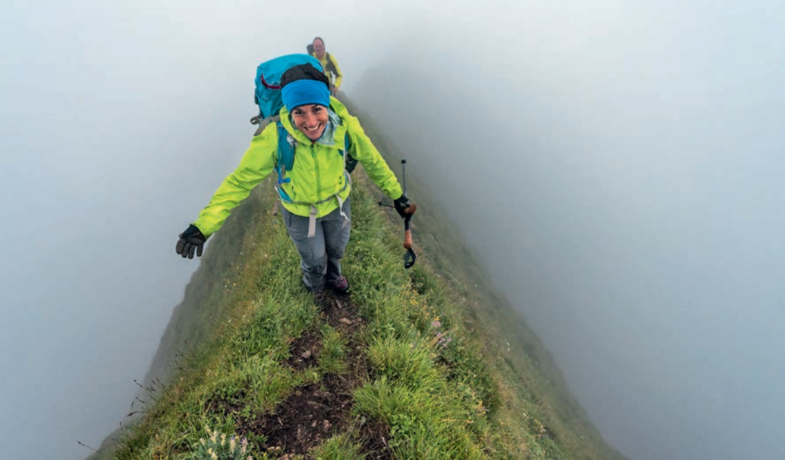
▲ Z pewnością nie na każdy gust – trawiaste ostrze na Tannhornie.

przy Lättgässli (miejsce oznaczone kotą 2175 m) zmienia stronę, by teraz obejść stroną północną pojawiające się skalne turniczki. Na przełęczy Chruterensattel, 2051 m, natrafiamy w końcu ponownie na grań, której odtąd praktycznie nie będziemy opuszczać. Co innego znakowany na biało-czerwono-biało szlak – dalszą drogę aż do szczytu Augstmatthorn wyznaczają dobre wydeptane ślady ścieżki wiodące trawiastą granią. Kontynuujemy wędrówkę, a to lekko zyskując, a to tracąc na wysokości, przy czym już po chwili miejscami wskazana jest jako taka pewność stawianych kroków, zwłaszcza gdy rankiem trawa jest jeszcze wilgotna, a trzeba w kilku miejscach trawersować tuż poniżej grani trawiastą flanką. Ostatnie spiętrzenie do Briefehörnli ⑥, 2164 m, pokonujemy po trawniku, poruszając się w stromym terenie. Zdobywanie metrów w pionie bardzo ułatwiają ścieżynki wydeptane przez poprzedników.